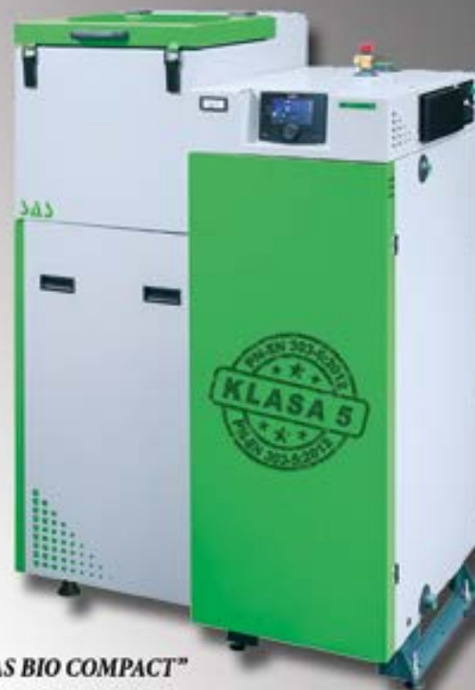
Kocioł „SAS BIO COMPACT”

WYKONAWSTWO INSTALACJI SANITARNYCH, GRZEWczyCH I GAZOWYCH