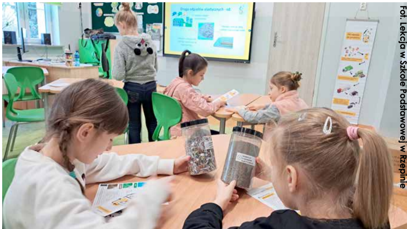
Fot. Lekcja w Szkole Podstawowej w Rzepinie

Edukacja na temat selektywnej zbiórki odpadów opakowaniowych to ważny temat, w szczególności jeśli chcemy, aby do recyklingu trafiło jak najwięcej cennych opakowań. Projekt ReFlex został zainicjowany przez firmy Nestlé Polska oraz PepsiCo Polska i koncentruje się na odpadach opakowaniowych powstających po produktach konsumenckich.