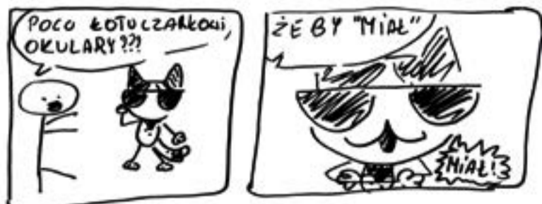
Komiks napisany przez Gabriellę Skrzypacz na zajęciach komiksowych w SOKu