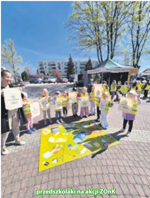
przedszkolaki na akcji ZOnK

Tegoroczne obchody Dnia Ziemi na terenie Celowego Związku Gmin CZG-12 można podporządkować szczególnie elektroodpadom. W obecnych czasach elektronika towarzyszy nam na każdym kroku – od telefonu w kieszeni, po zegarek, słuchawki bezprzewodowe, pralki, laptopy i inne drobne urządzenia LED. Właściwa segregacja odpadów elektrycznych i elektronicznych oraz baterii to nie tylko nasz obowiązek ale także sposób na ochronę środowiska i odzysk cennych surowców.