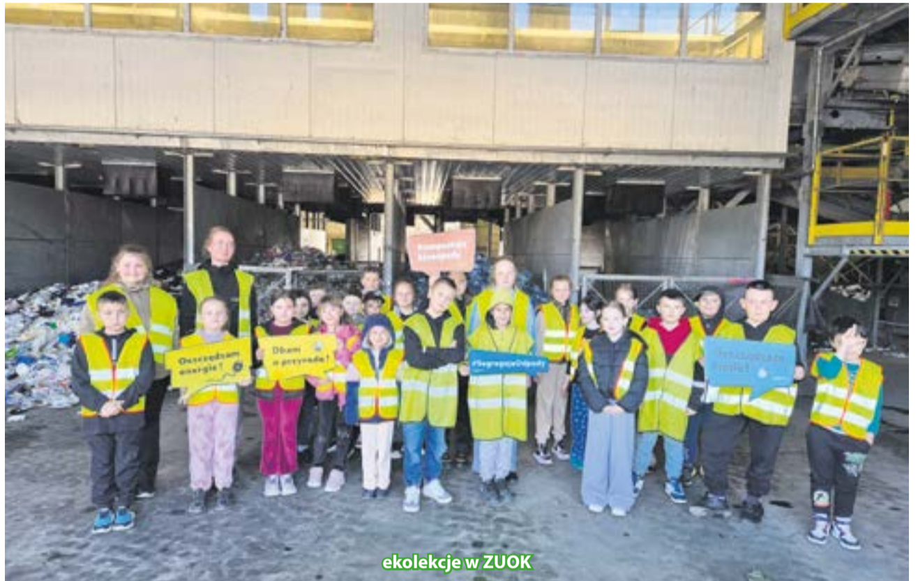
ekolekcje w ZUOK