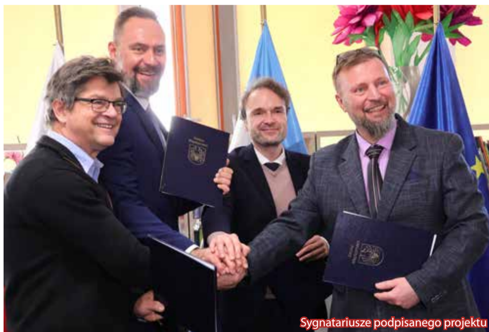
Sygnatariusze podpisanego projektu

W projekcie „Żywe Miejsca Pamięci” uczestniczy siedem polskich i niemieckich miast, instytucji i stowarzyszeń. Przygotowania trwały kilka lat. Inicjatorem była Gmina Międzyrzecz - obecnie jest liderem projektu, który realizowany będzie przez najbliższe trzy lata na podstawie partnerskiej umowy, podpisanej 18 marca w międzyrzeczkiej bibliotece. Swoje podpisy