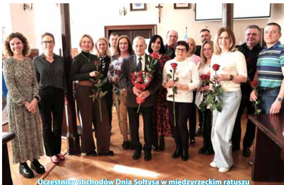
Uczestnicy obchodów Dnia Sołtysa w międzyrzeczkim ratuszu