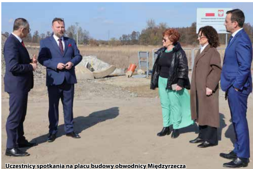
Uczestnicy spotkania na placu budowy obwodnicy Międzyrzecza