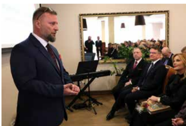
Wystąpienie burmistrza Międzyrzecza