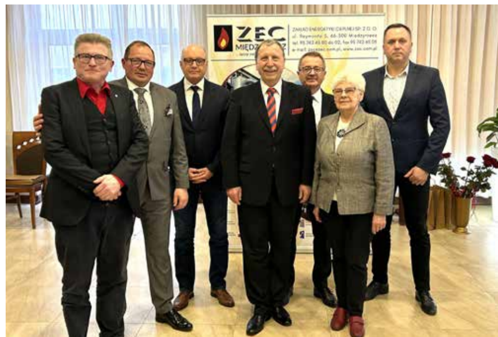
Wspólna fotografia radnych z prezesem