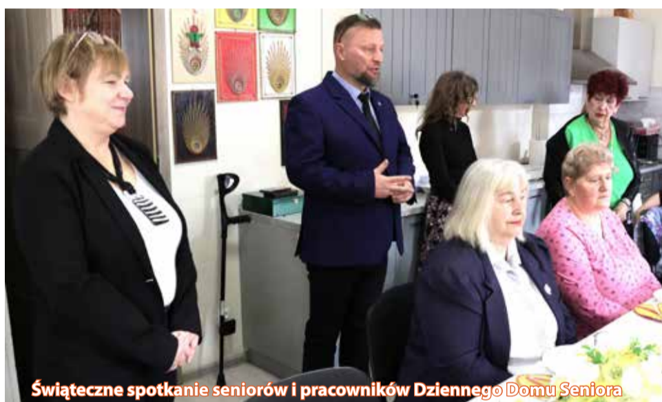
Świąteczne spotkanie seniorów i pracowników Dziennego Domu Seniora

Dzienny Dom Seniora jest jednym z ogniw Centrum Usług Społecznych. Placówka jest drugim domem dla seniorów, którzy rozwijają w niej swoje zainteresowania i uzdolnienia oraz spędzają czas w miłej, prawdziwie rodzinnej atmosferze. W środę, 1 kwietnia, pracownicy i seniorzy spotkali się na wielkanocnym śniadaniu przygotowanym przez międzyrzeckie seniorki i panie z DDS.