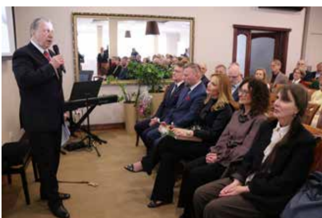
Historię i plany inwestycyjne firmy przedstawił Prezes ZEC