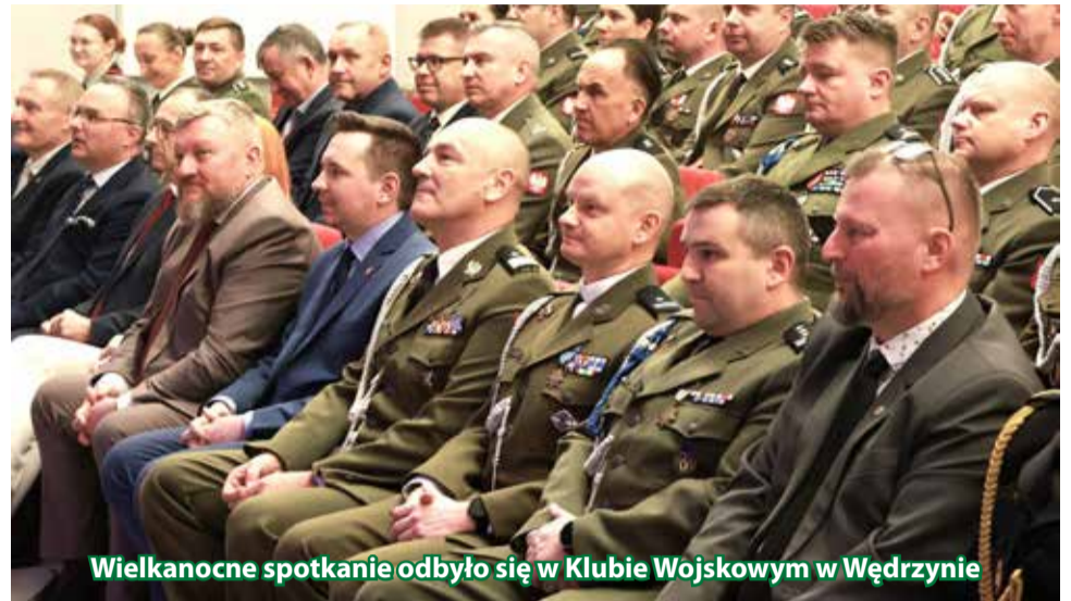
Wielkanocne spotkanie odbyło się w Klubie Wojskowym w Wędrzynie