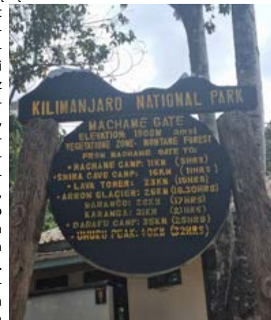
Początek drogi Machame Road, zwana również Whiskey Road