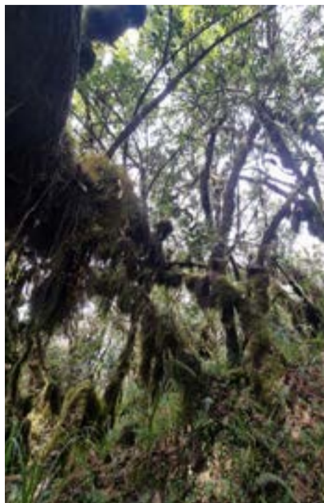
Droga przez dżunglę

Pomimo deszczu humory nam dopisywały i ok. godz. 18 dotarliśmy do