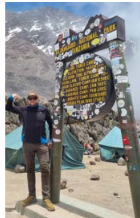
Lava Tower na wysokości 4600 m

Temperatura w nocy w Shira Camp spadła kilka stopni poniżej 0. W takich miejscach przydaje się ciepły śpiwór z termiką do przynajmniej -5 stopni.