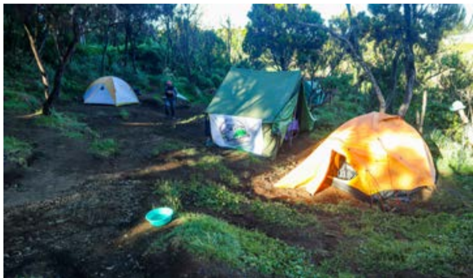
Pierwszy obóz - Machame Camp na wysokości 2835 m n.p.m.