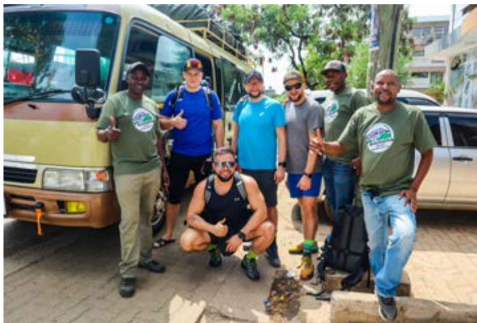
Spotkanie naszej ekipy z przewodnikami jeszcze przed hotelem

Pierwszy etap podróży samolotem do Paryża minął szybko w małym, zgrabnym Airbusie A220-300. Dolecieliśmy prawie punktualnie, co miało duże znaczenie, bo na przesiadkę do samolotu do Tanzanii mieliśmy niecałą godzinę. Niestety, nie spisała się obsługa naziemna lotniska, bo przez 20 minut czekaliśmy na pod-