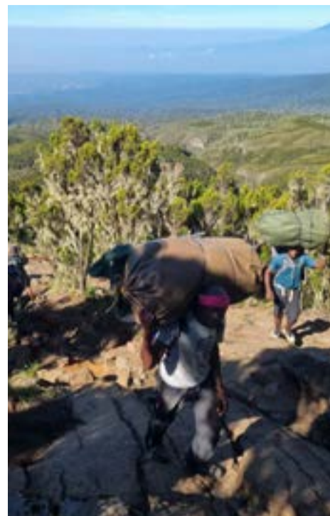
Porterzy w pracy

pierwszego obozu Machame Camp. Nasze namioty stały już rozłożone. Po godzinie w specjalnym namiocie jadalnym kucharz zaserwował nam kolację. Każdy posiłek zaczynał się od zupy. Były to zawsze polewki ugotowane z proszku. Zwykle całkiem smaczne. Zapewne ich najważniejszym zadaniem było rozgrzać nasze żołądki. W przypadku właściwego dania nigdy nie mieliśmy powodu do narzekań. Kucharz wspinał się na wyżyny biwakowego gotowania. W pierwszym dniu na kolację dostaliśmy smażoną rybę z ziemniakami z wody i