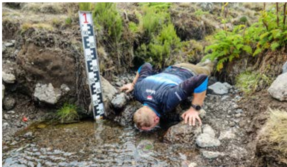
Miło było zanurzyć się w strumieniu