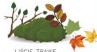
LIŚCIE, TRAWĘ, DROBNE GAŁĘZIE