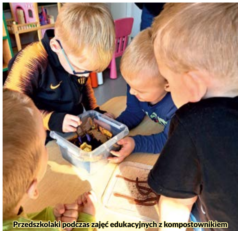
Przedsiębiorcy podczas zajęć edukacyjnych z kompostownikiem