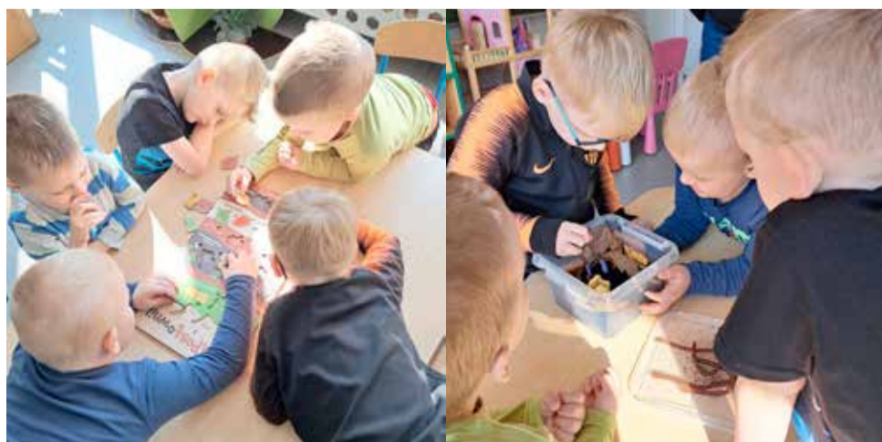
Fot. zajęcia edukacyjne w Przedszkolu im. „Pszczółki Mai” w Torzymiu