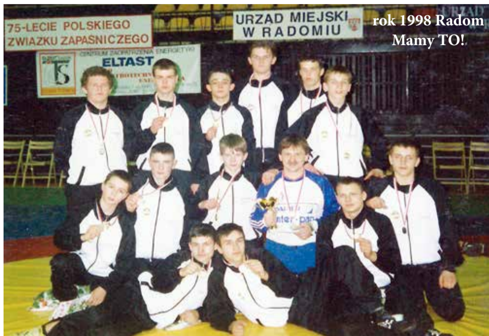
rok 1998 Radom Mamy TO!